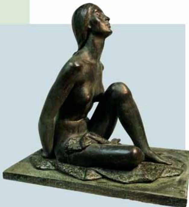
"BESO AL SOL" (1974) _ Bronce patinado al fuego 47 cm. _ Edición de 30 ejemplares + 5 PA _ 6.050 € (IVA inc)