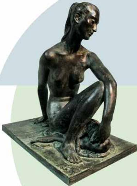
"MUJER SENTADA II" (1991) _ Bronce patinado al fuego 45 cm. _ Edición de 30 ejemplares + 5 PA _ 6.655 € (IVA inc)