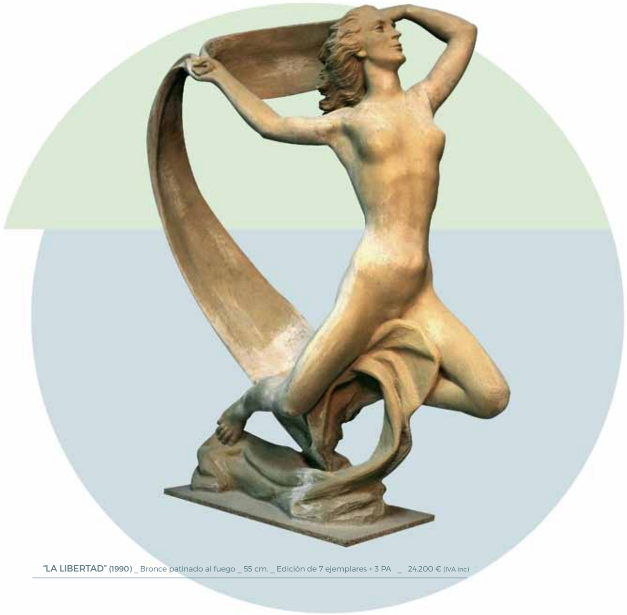
"LA LIBERTAD" (1990) _ Bronce patinado al fuego _ 55 cm. _ Edición de 7 ejemplares + 3 PA _ 24.200 € (IVA inc)