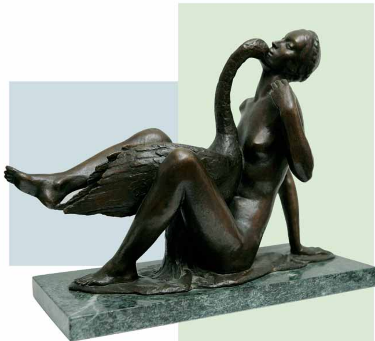
"LEDA Y EL CISNE" (1999) _ Bronce patinado al fuego _ 50 cm. _ Edición de 7 ejemplares + 3 PA _ 24.200 € (IVA inc)