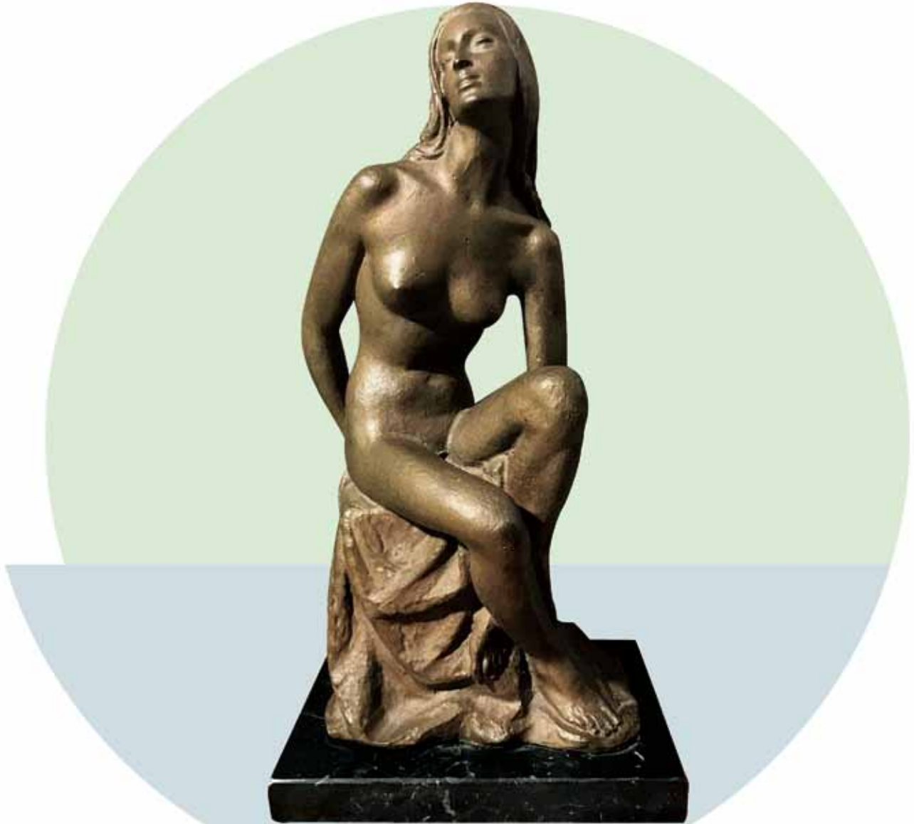
"SALIENDO DEL BAÑO" (1960) _ Bronce patinado al fuego _ 28 cm. _ Edición no limitada _ 1.573 € (IVA inc)