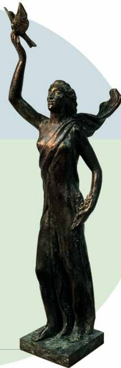
"LA PAZ. BOCETO DEL MONUMENTO A LAS FUERZAS ARMADAS EN BURGOS" (1983) Bronce patinado al fuego _ 80 cm. _ Edición de 30 ejemplares + 5 PA _ 8.470 € (IVA inc)