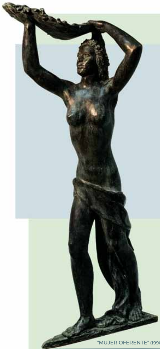
"MUJER OFERENTE" (1990) _ Bronce patinado al fuego _ 78 cm. _ Edición de 30 ejemplares + 5 PA _ 8.470 € (IVA inc)