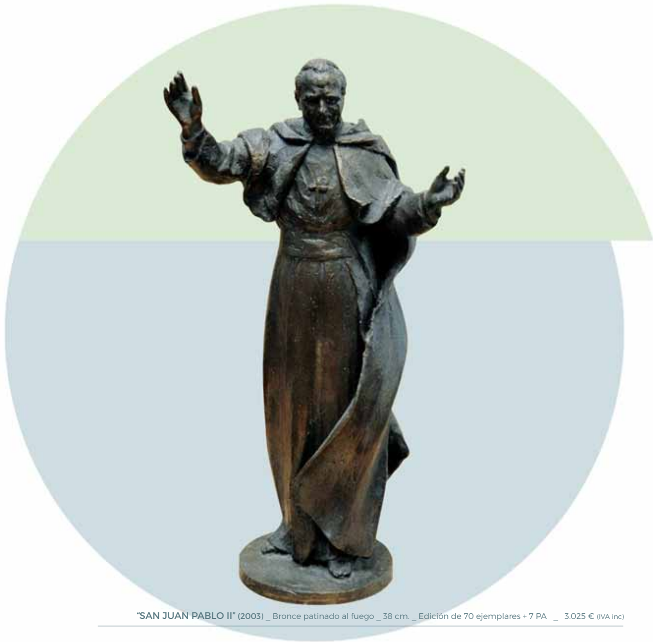
"SAN JUAN PABLO II" (2003) _ Bronce patinado al fuego _ 38 cm. _ Edición de 70 ejemplares + 7 PA _ 3.025 € (IVA inc)