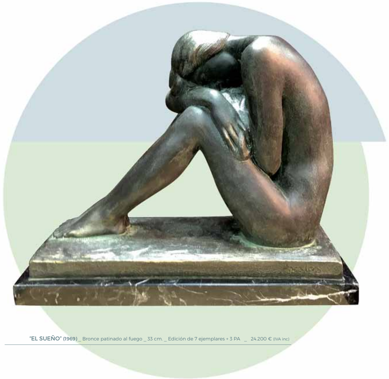
"EL SUEÑO" (1969) _ Bronce patinado al fuego _ 33 cm. _ Edición de 7 ejemplares + 3 PA _ 24.200 € (IVA inc)