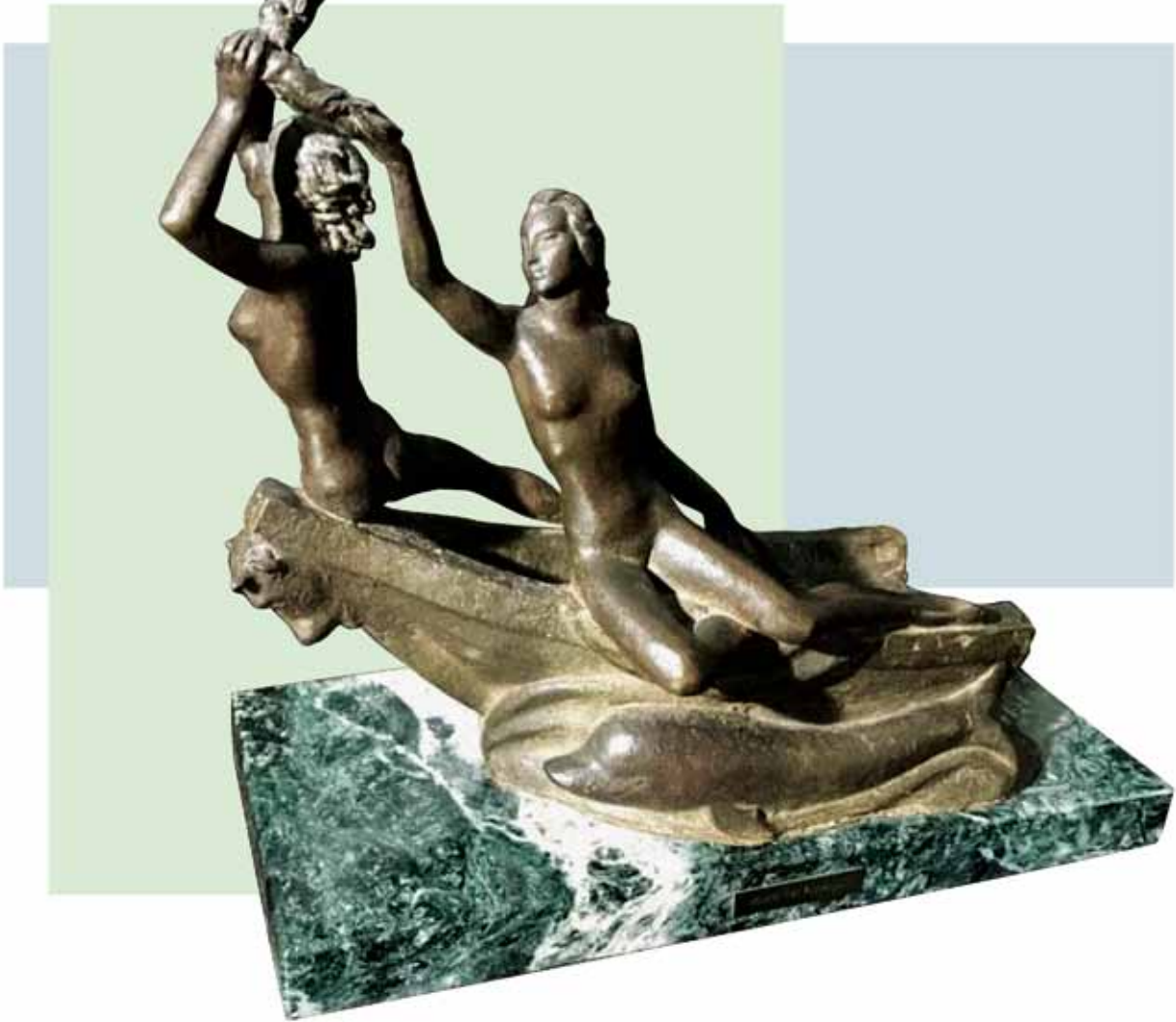
"LA BARCA" (1974) _ Bronce patinado al fuego _ 35 cm. _ Edición de 7 ejemplares + 3 PA _ 15.730 € (IVA inc)