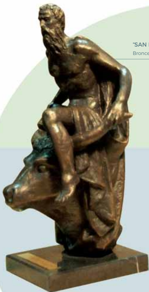
"SAN LUCAS EVANGELISTA" (1951)

Bronce patinado al fuego _ 15 cm. _ Edición de 70 ejemplares + 7 PA _ 3.025 € (IVA inc)