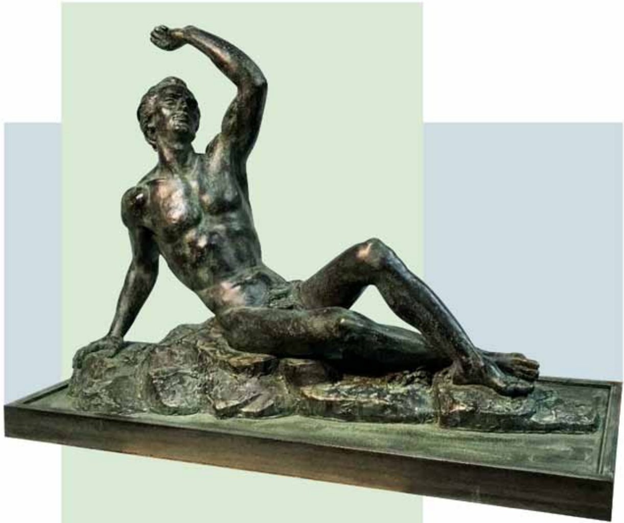
"EL HOMBRE DE LA MONTAÑA" (1975) _ Bronce patinado al fuego _ 75 cm. _ Edición de 7 ejemplares + 3 PA _ 21.780 € (IVA inc)