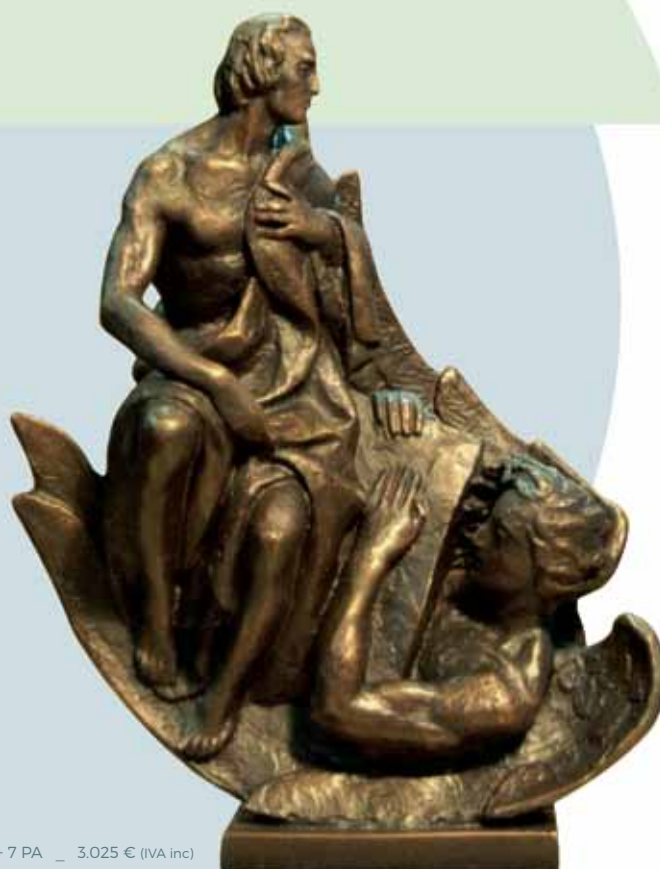
"SAN MATEO EVANGELISTA" (1951)

Bronce patinado al fuego _ 15 cm. _ Edición de 70 ejemplares + 7 PA _ 3.025 € (IVA inc)