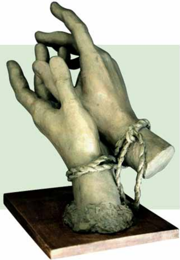
"LA CUERDA" (2004) _ Bronce patinado al fuego 48 cm. _ Edición de 7 ejemplares + 3 PA _ 18.150 € (IVA inc)