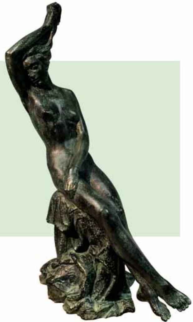
"LUNA CON PARCAS" (1974) _ Bronce patinado al fuego 61 cm. _ Edición de 30 ejemplares + 5 PA _ 6.655 € (IVA inc)