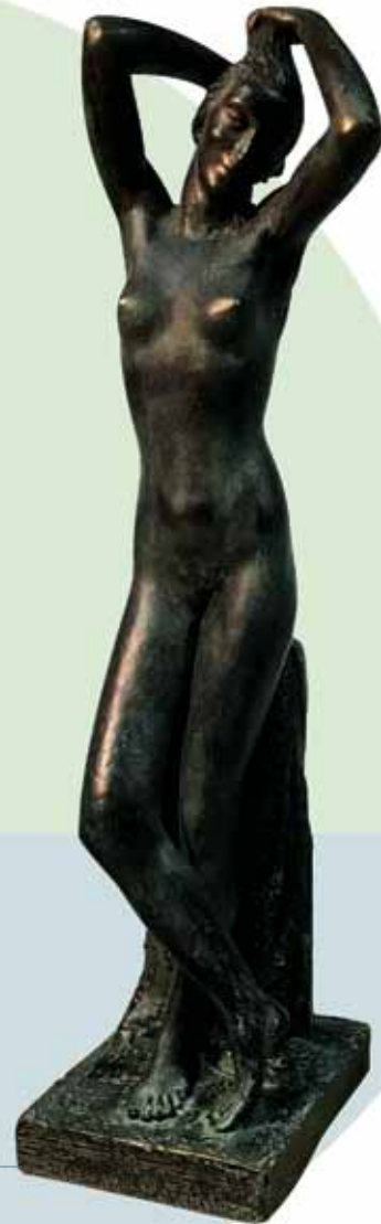
"LA COQUETA" (1974)

Bronce patinado al fuego _ 45 cm. _ Edición no limitada _ 4.235 € (IVA inc)