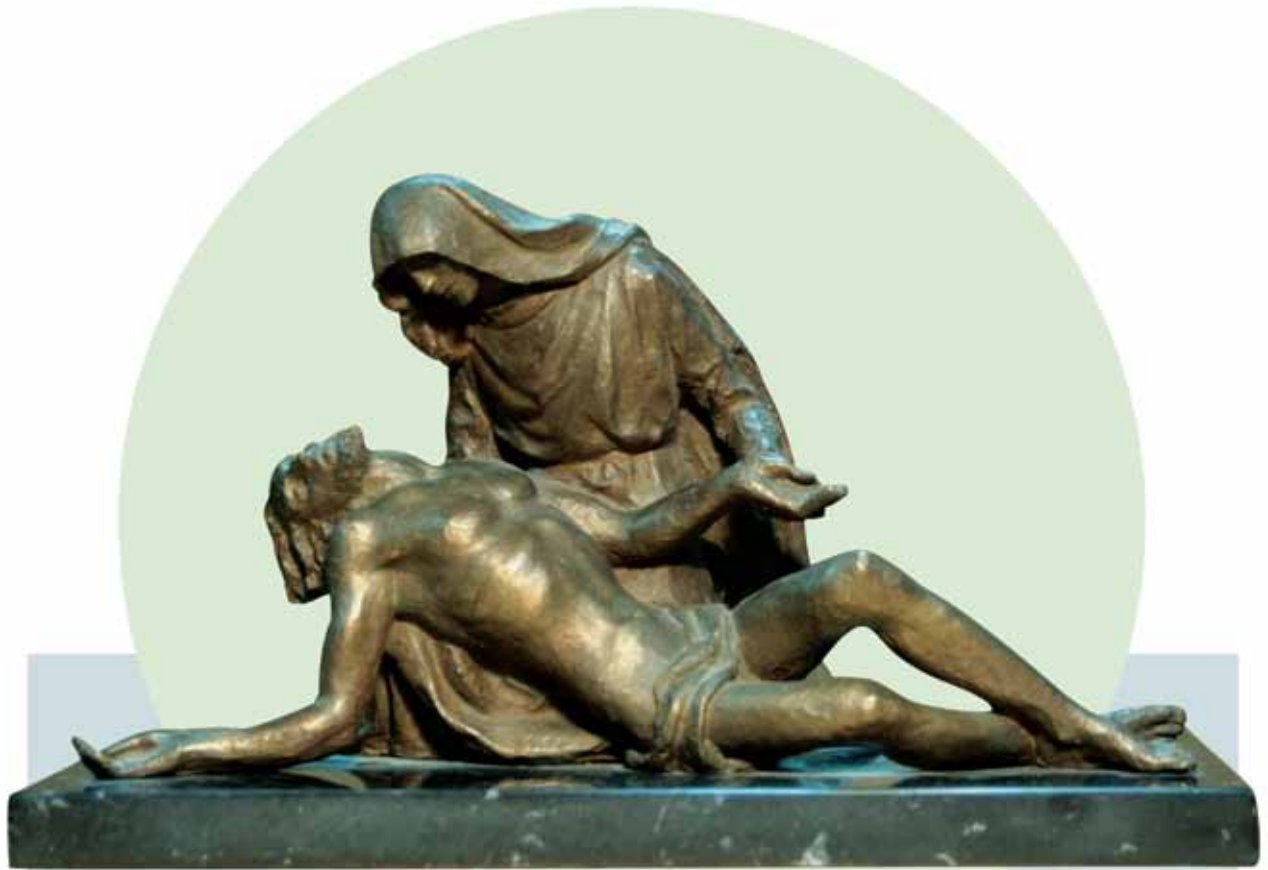
"LA PIEDAD" (1951) _ Bronce patinado al fuego _ 25 cm. _ Edición de 70 ejemplares + 7 PA _ 3.025 € (IVA inc)