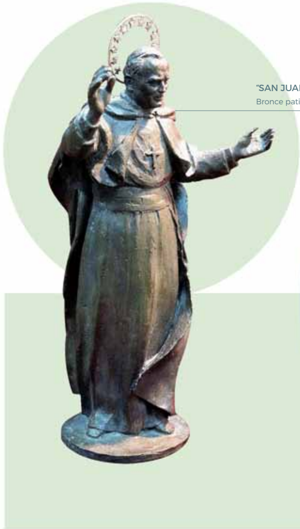
"SAN JUAN PABLO II" (2003)

Bronce patinado al fuego _ 68 cm. _ Edición de 30 ejemplares + 5 PA _ 6.050 € (IVA inc)