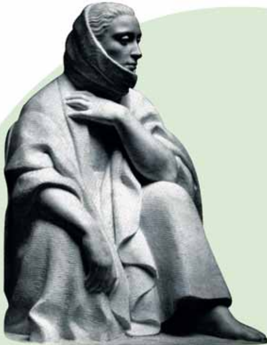
"MUJER DE NAZARÉ" (1945)

Bronce patinado al fuego _ 45 cm. _ Edición no limitada _ 4.235 € (IVA inc)